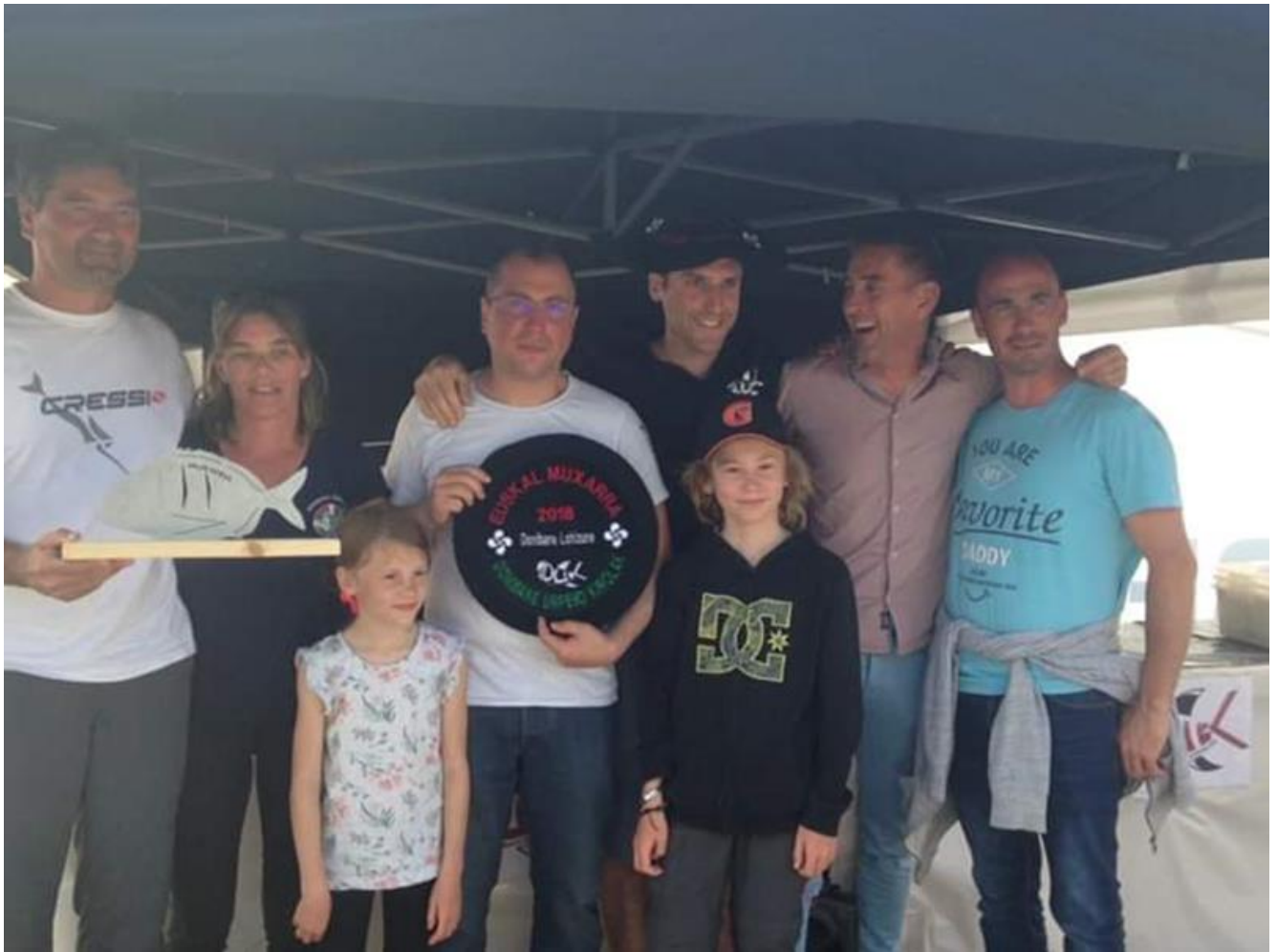
Photo du podium de la 2 ème édition de l'Euskal Muxarra

C'est avec plaisir que nous vous accueillerons à Saint-Jean-de-Luz, le dimanche 9 juin pour ce trophée.